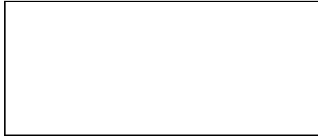
Abb. 3. Elektronenogramm, x 8. 000. Dornartige Keratinozyten haben keine Desmosomkontakte, breite interzelluläre Räume hindern die Bildung der vollwertigen Zellschicht. Der 14. Tag nach der Einwirkung von Surgitron.