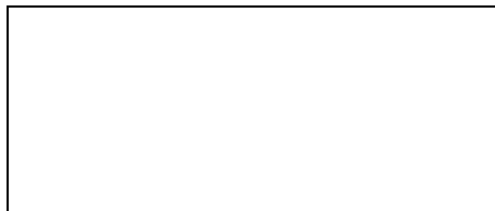
Abb. 2. Elektronenogramm x 8. 000.

Systemlose Anordnung der Kollagenfibrillen im Hautderma der Ratten nach der Radiowelleneinwirkung am dritten Tag. Es werden freiliegende Keratohyalin granula demonstriert.